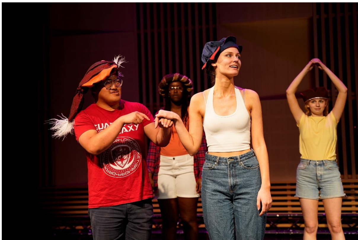
Under Frejas teatersommar fick ungdomar med diagnos inom autismspektrat prova på teater.

Genom att delta i nationella nätverk och genom att inhämta och sprida kunskap internt och externt, arbetade Kulturutveckling med FN:s barnkonvention och alla barns och ungas rätt till kultur. Kulturstrategen satt med i styrgruppen för Region Jönköpings läns handlingsplan kring barnrättsfrågor. Beviljade utvecklingsmedel och aktivt deltagande i styrgruppen för Kulturrätten är en viktig del av arbetet för alla barns och ungas rätt till kultur.