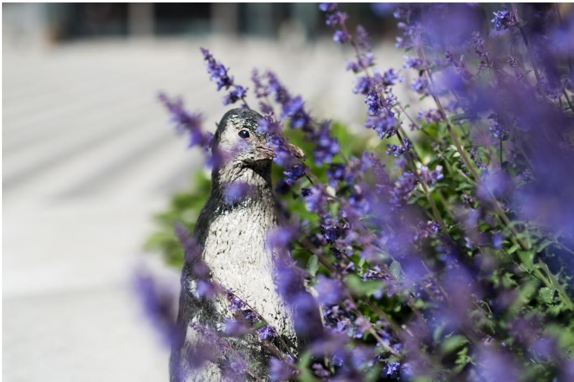
Pingvin utanför Höglandssjukhuset Eksjö, skapad av Roland Persson.

Konstverk som inte längre tjänar sitt syfte, på grund av dåligt skick, bör avskrivas regelbundet. Konst i offentliga miljöer utsätts dagligen för större slitage än konstverk som hänger i klimatanpassade lokaler, konsthallar och museer. Avskrivning bör även innefatta utomhusskulpturer som genom åren utan kontinuerlig översyn har tillåtits förfalla. Inventering av Regionen Jönköpings läns konstsamling avslutades 2022 och skadad ej brukbar konst avyttrades.