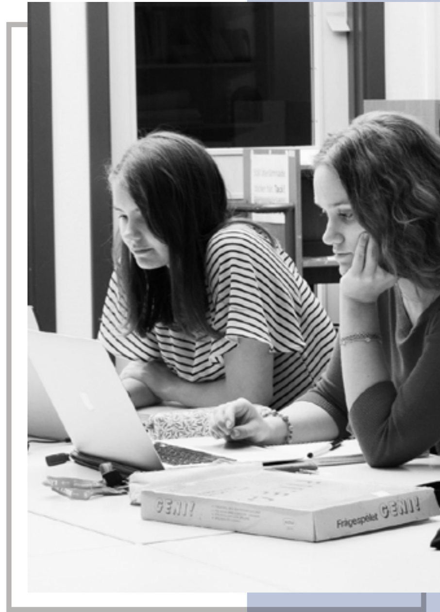
"Jag tycker att utbildningen är väldigt lärorik och varierad"