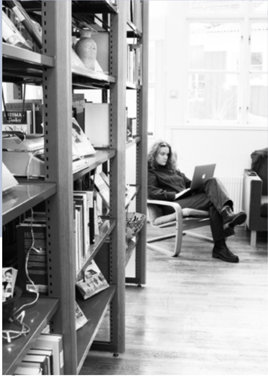
"Alla får vara sig själva, det är en väldigt fin miljö"