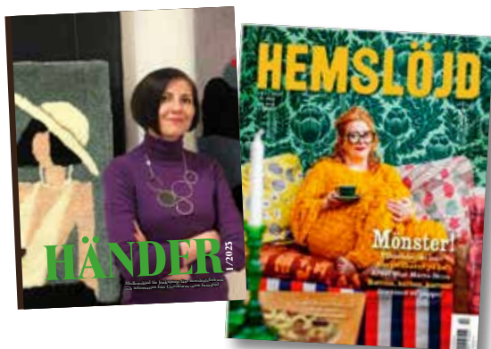
Händer nr 1 2025

Du hittar info om föreningarna här till höger.