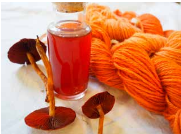
Garn färgat med rödskivig kanelspindling

För slöjd handlar inte bara om att skapa, utan om att hitta rytmen i något som är större än en själv. Det är att se skönhet i det som andra kanske kallar rester och spillbitar, att förstå värdet av varje tråd och varje stygn. Det är därför jag älskar rutor – mormorsrutor, lappteknik, skarvsöm. Små, enskilda delar som växer och fogas samman till något större. Varje stygn är en länk mellan dåtid och nutid, mellan tanke och handling. Man tar vad man har – gamla tygbitar, udda garnstumpar – och skapar något nytt. Snällhet, säger vissa. Ren och skär magi, säger jag.