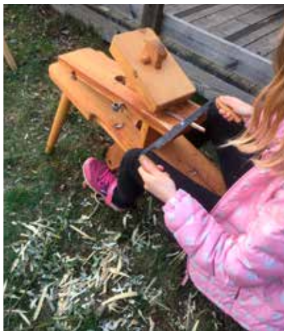
Barn som täljer med täljhäst