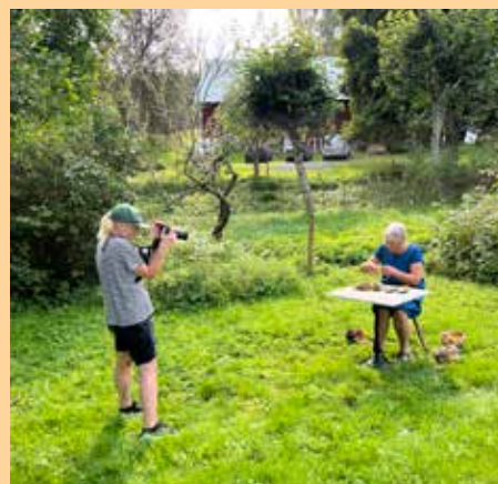
Bild från inspelningen av filmen Sparsamhetslöjd