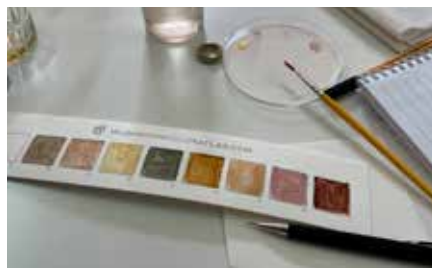
Pigment från svamp

Dagarna var fullspäckade med workshops eller utflykter på förmiddagarna och föreläsningar på eftermiddagarna.