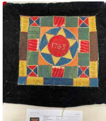
Skarvsömsdyna J.M 10755

Där stod jag och funderade över kudden och drömde mig tillbaka mer än 250 år. Tillbaka till en tid när de flesta i Småland bodde i små stugor