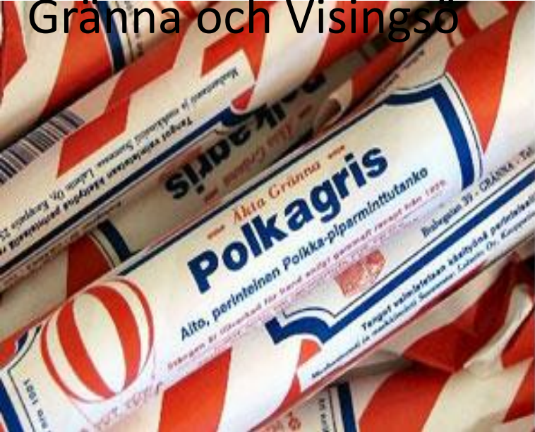
Gränna och Visingsö