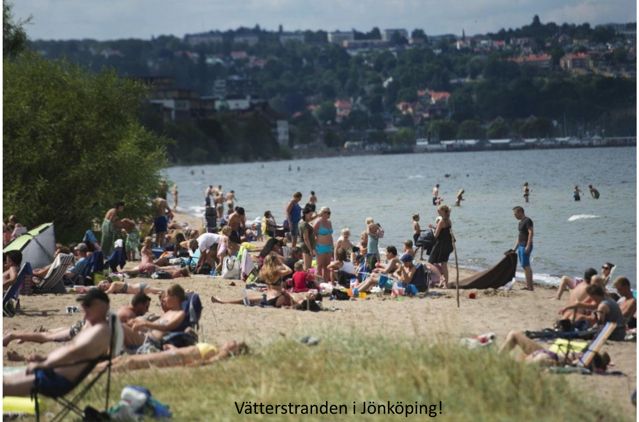
Vätterstranden i Jönköping!