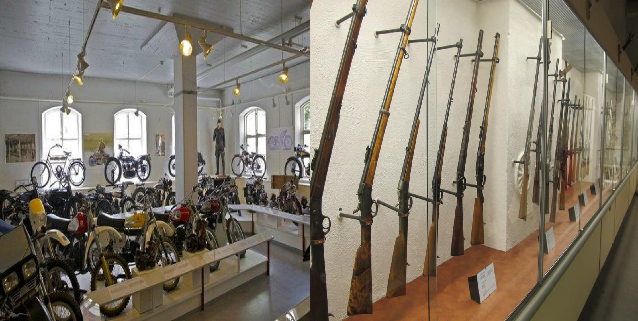
Mera från Huskvarna Fabriksmuseum, som ligger mitt emot Smedbyn