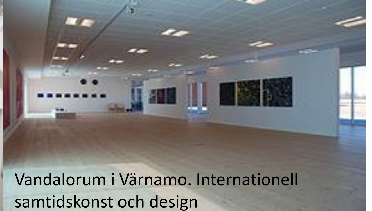
Vandalorum i Värnamo. Internationell samtidskonst och design