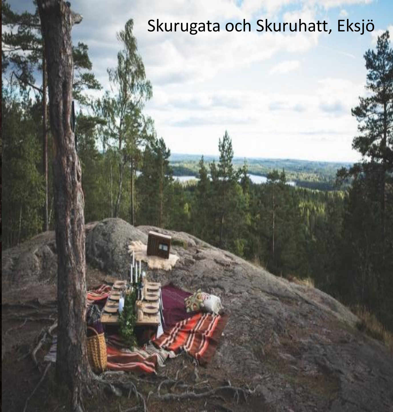
Skurugata och Skuruhatt, Eksjö