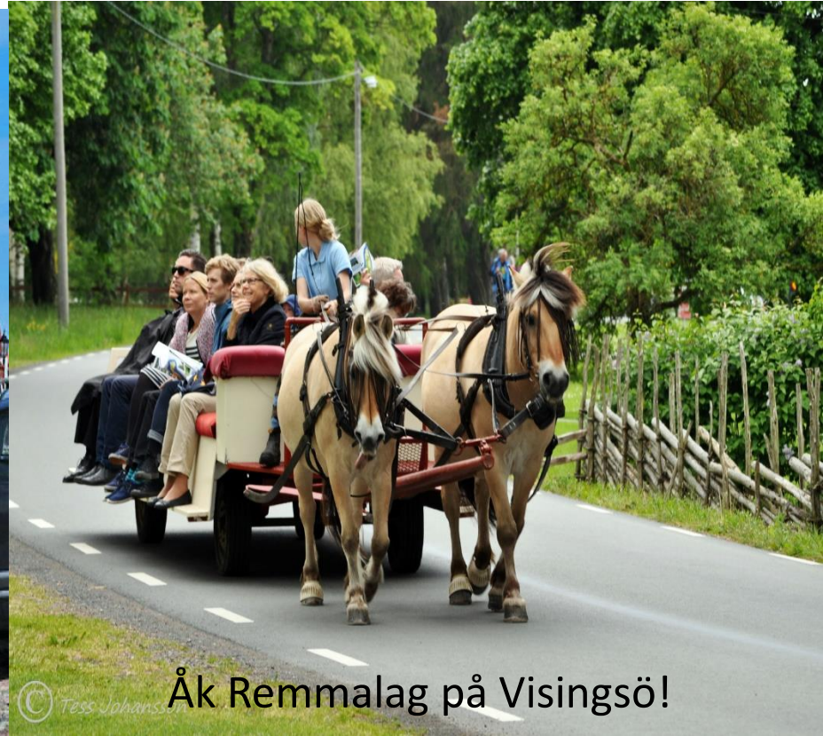
© Tess Johansson Åk Remmalag på Visingsö!