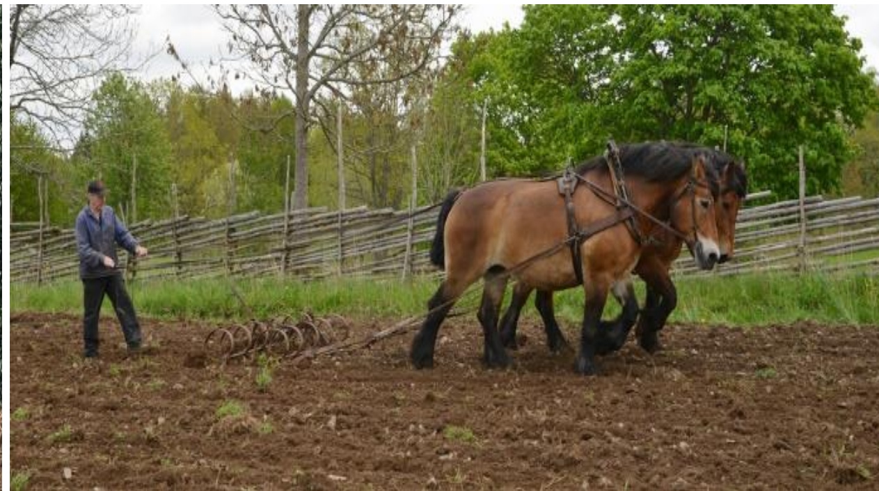
Åsens by, Haurida Aneby. Sveriges första kulturresevat, med miljöer från 1900. Fri entré