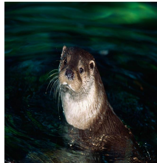
Utter, Smålands landskansdjur