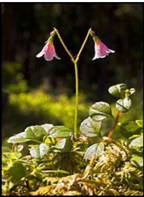
Linnéa, Smålands landskansblomma