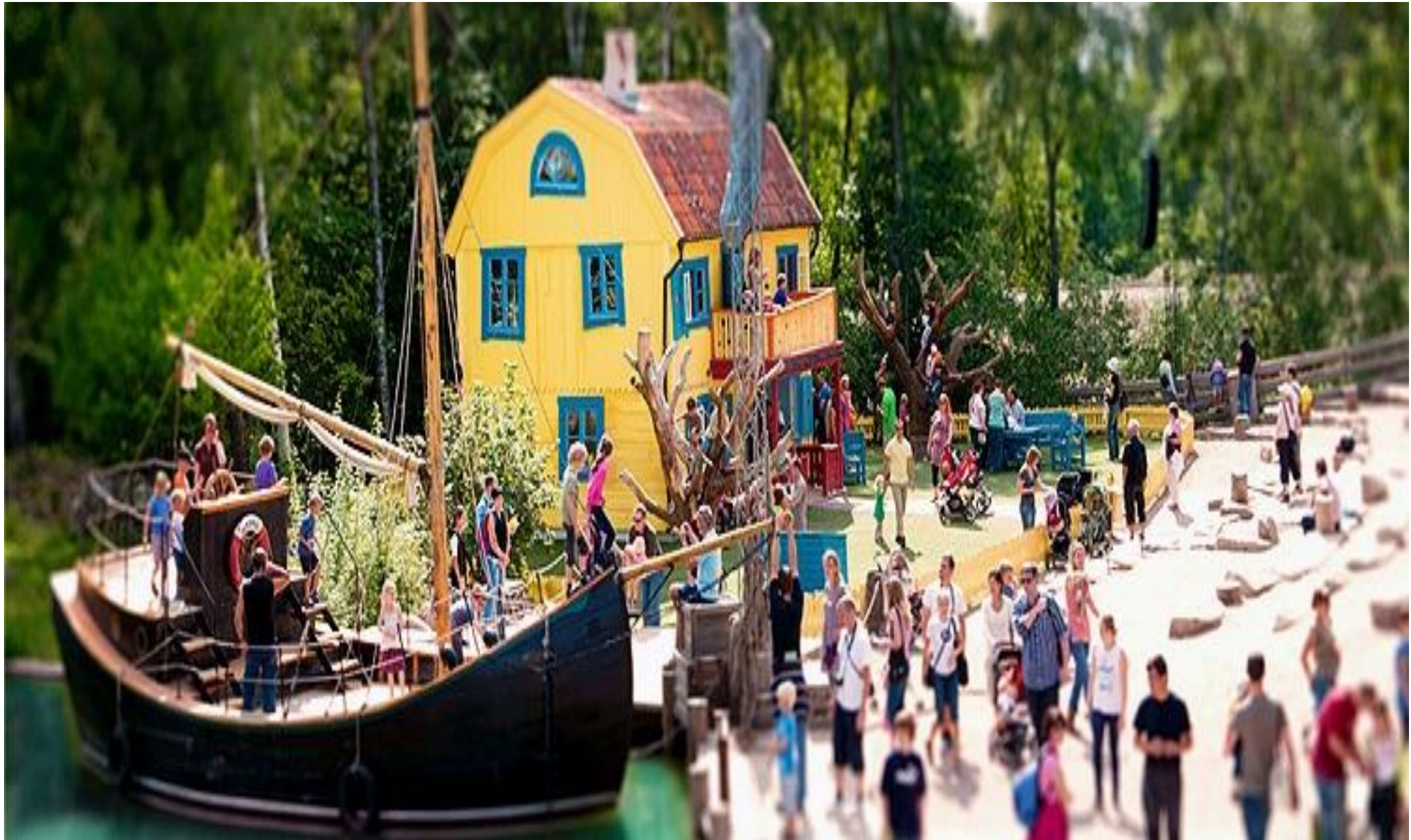
Astrid Lindgrens värld i Vimmerby – för hela familjen, föreställningar, gatuteater och musik!