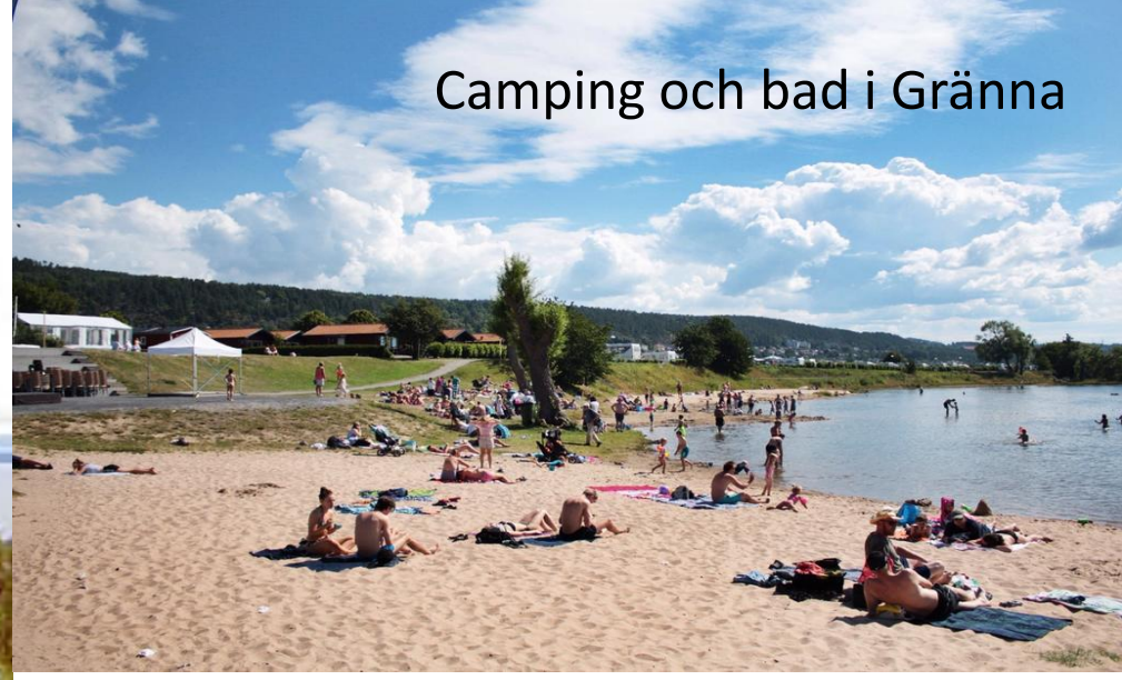
Camping och bad i Gränna