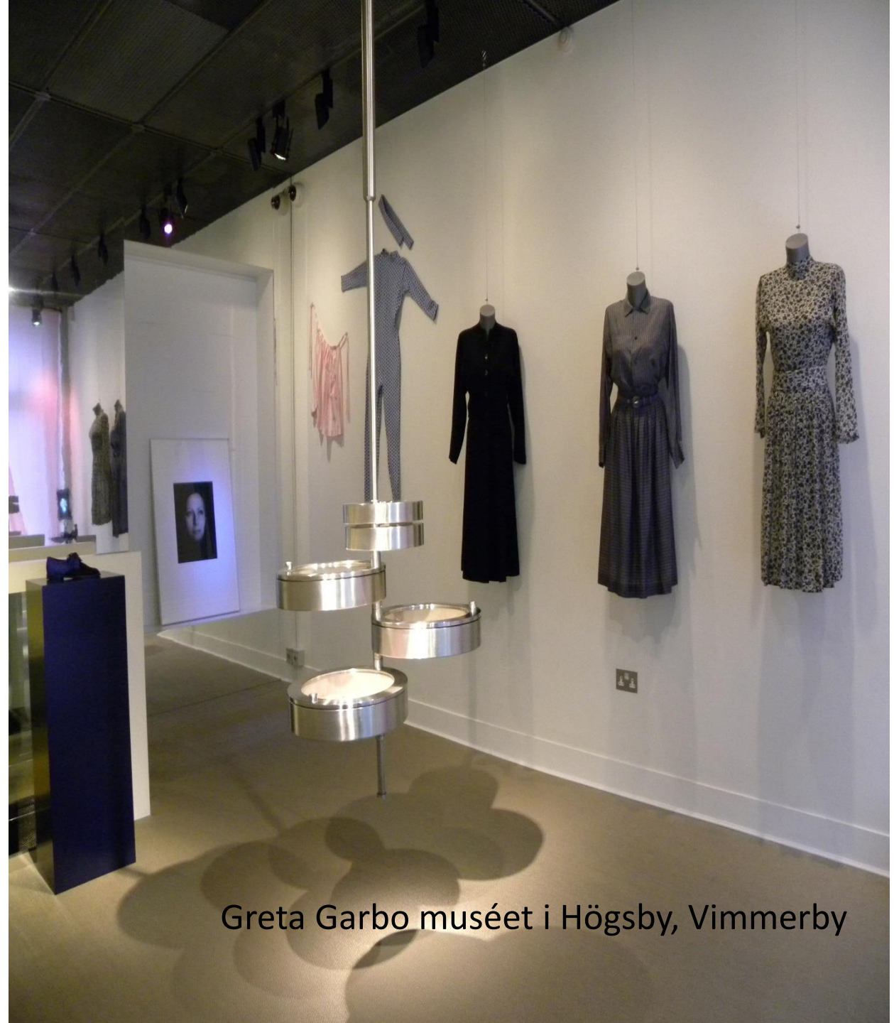
Greta Garbo muséet i Högsby, Vimmerby