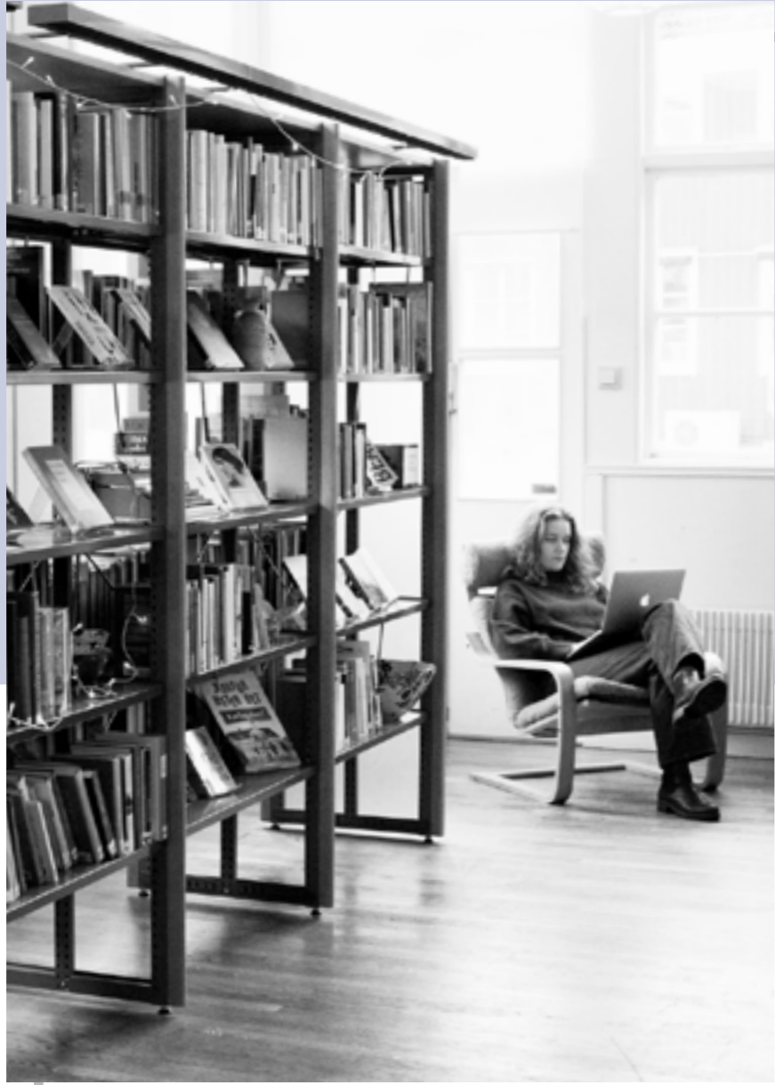
"Alla får vara sig själva, det är en väldigt fin miljö"